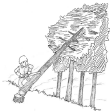
図5 かかっている木の元玉切り

り禁止するものではないが、かかり木の処理の作業を安全に行うものであるとは言えないこと。