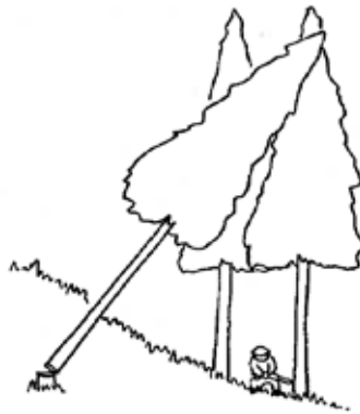
図3 かかり木にかかられている立木を伐倒

（参考1）「かかり木にかかられている立木を伐倒」とは、図3のとおり、かかられている立木を伐倒することにより、当該伐倒木及びかかり木を一体的に伐倒させること。