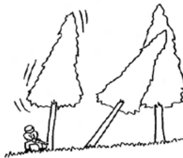
図4 かかり木に激突させるためにかかり木以外の立木を伐倒

（参考2）「かかり木に激突させるためにかかり木以外の立木を伐倒」とは、図4のとおり、他の立木を伐倒し、かかり木に激突されることにより、かかり木を外す（いわゆる浴びせ倒し）こと。